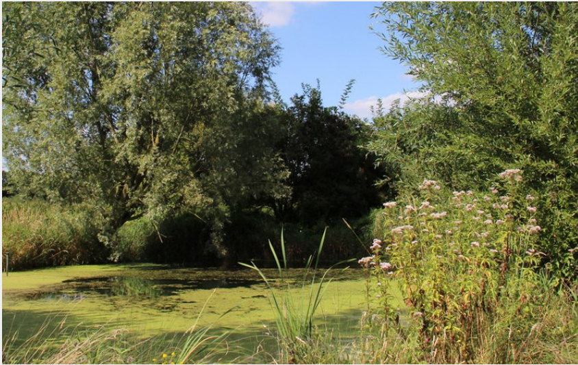
Marais d'Athies (Eden 62)