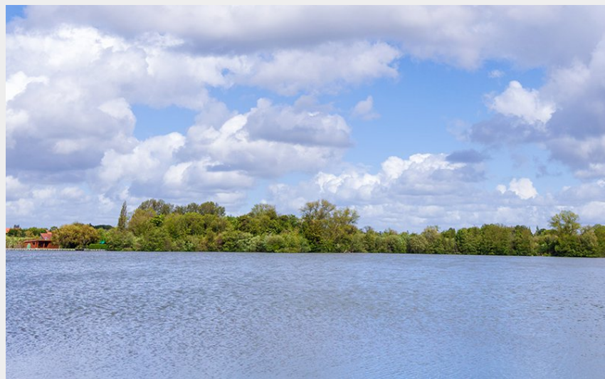
Lac d'Ardres (Eden 62)