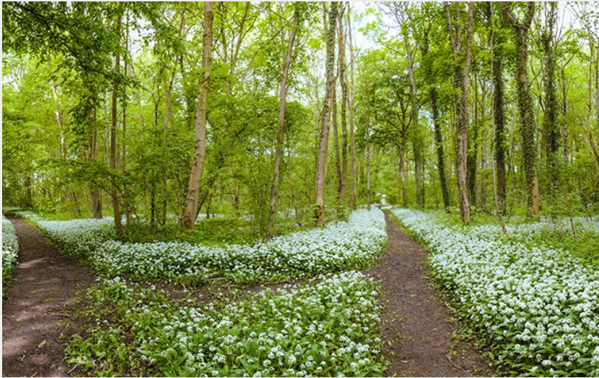
Bois des Hautois - 9/9 bis (Eden 62)