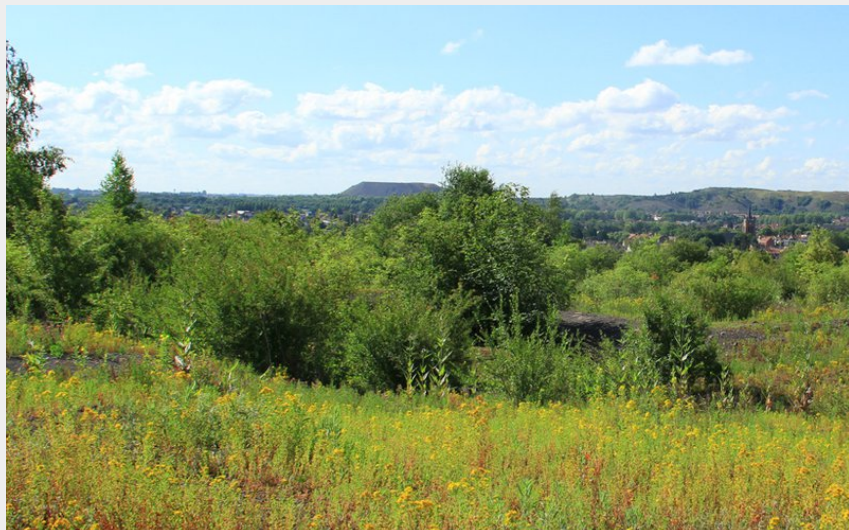
Terrils du marais de Fouquières (Eden 62)