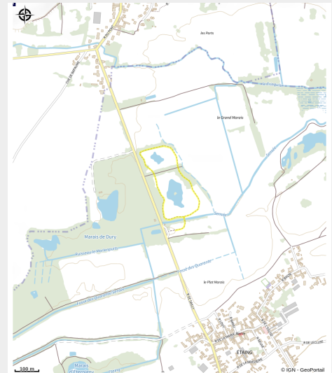
Grand marais d'Etaing (Eden 62)