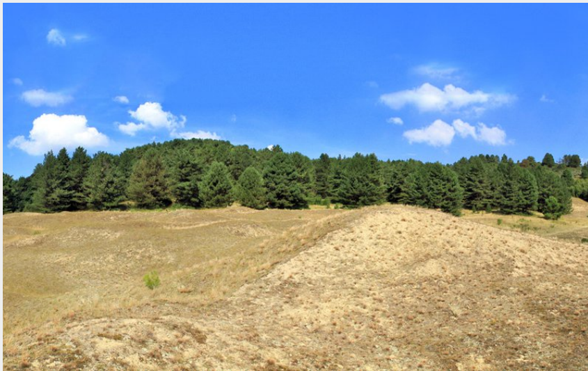
Dunes du Mont Saint-Frieux (Eden 62)